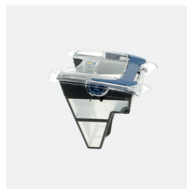
Bac filtrant (3L) débris fins 100 microns