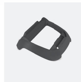
Socle pour boîtier de commande