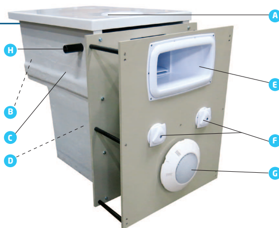
Schéma de principe d'un GS14