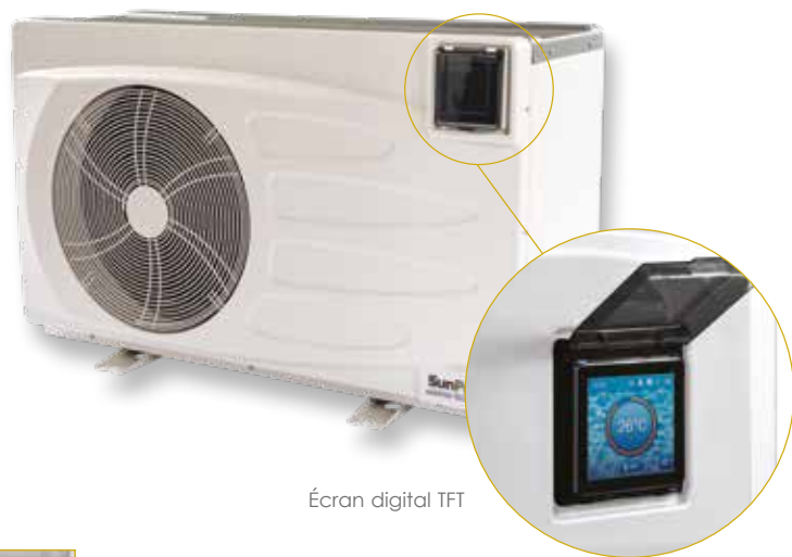
Écran digital TFT